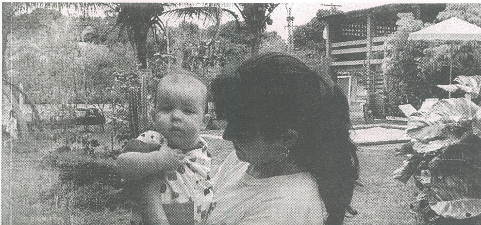
Vista parcial do jardim do Hotel