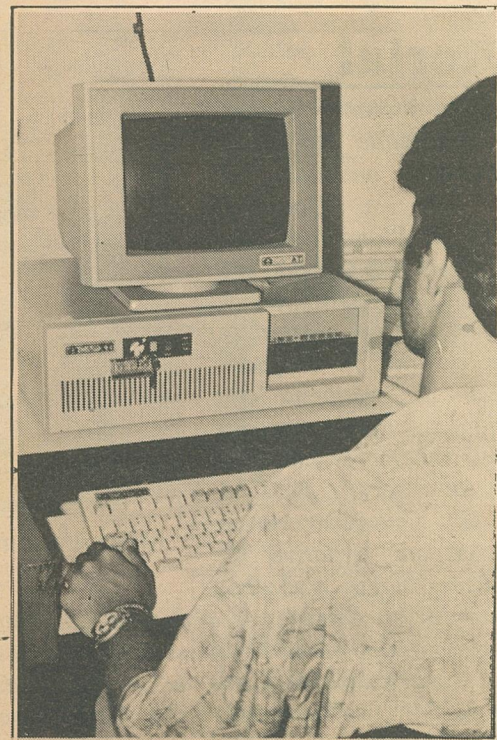
Informática: "Uma conquista dos extras"

placar de 5% contra 30%. Mesmo assim, não esqueça de honrar essa dívida. Os "atrasadinhos" podem sair prejudicados com o levantamento de uma Certidão de Dívida Ativa. E o "jeitinho brasileiro" pode ter um final infeliz. O débito será cobrado devidamente corrigido e os bens sofrem ameaça de penhora.