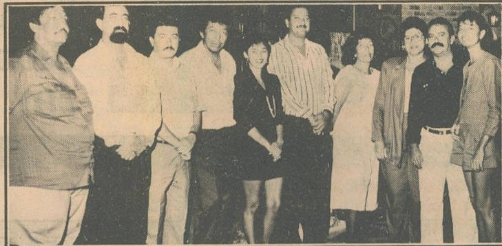
Biomédicos de Pernambuco em festa pelo Dia Nacional

Vinte de novembro soa para todos os biomédicos como a vitória de um disputado e decisivo campeonato. Afinal, foi nesta mesma data que, em 1985, o Supremo Tribunal Federal decidiu pela inconstitucionalidade das Leis nº 6.686 e 7.135- uma dupla dinâmica que pretendia extinguir toda a nossa classe.