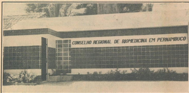
Conforto e organização para toda categoria

Assim, os associados em Pernambuco irão receber, através do Correio, carnês com 129 UFIR. Quem liquidar a dívida de uma só vez poderá fazê-lo, tendo os seguintes descontos: Para janeiro - 30%; fevereiro, 20% e março, 10%. Aqueles que preferem o estilo "crediário" irão desembolsar três parcelas de 43 UFIR. A partir de abril serão acrescidos juros e correção monetária. Isto sem falar no caixa do CRBM-PE começar a ficar atrapalhado. Portanto, faça economia e honre seus compromissos com o Conselho! Você só tem a ganhar.