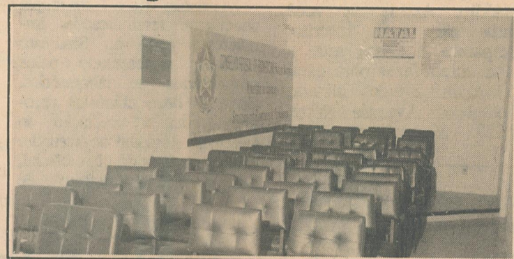
Audatório do CRBM-PE

Nesse ínterim já havíamos realizado e com sucesso absoluto o Iº Congresso Brasileiro de Biomedicina. O encontro reuniu nos salões do